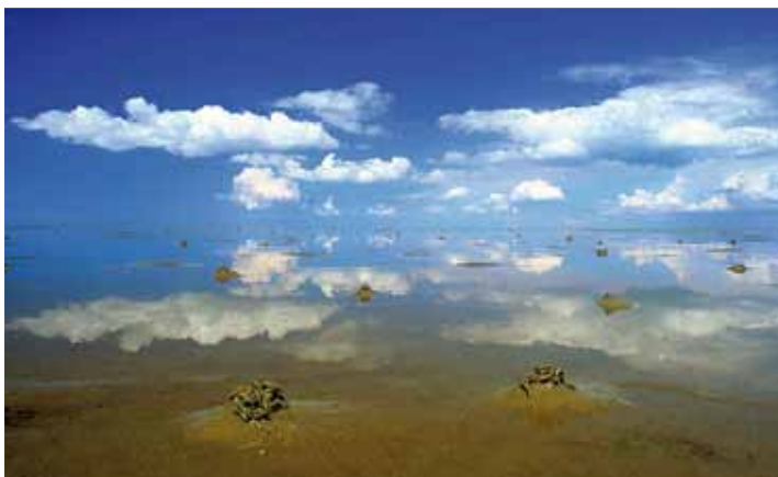
Foto-Festival Nationalpark Wattenmeer