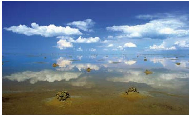
Foto-Festival Nationalpark Wattenmeer